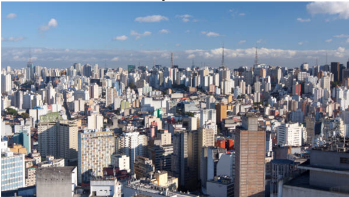
São Paulo é a cidade com maior concentração urbana do Brasil.

O processo de urbanização, além de ocorrer de forma desigual, não só no Brasil mas em diversas partes do mundo, dá-se de forma desordenada, apontando então a falta de planejamento. Isso acarreta diversos problemas urbanos de ordem social e ambiental. São alguns deles: